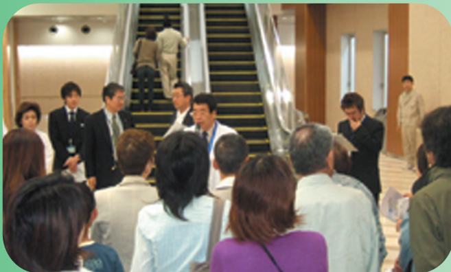
メインエントランスでの院長あいさつ