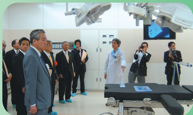
式典終了後の新病院見学(手術室)