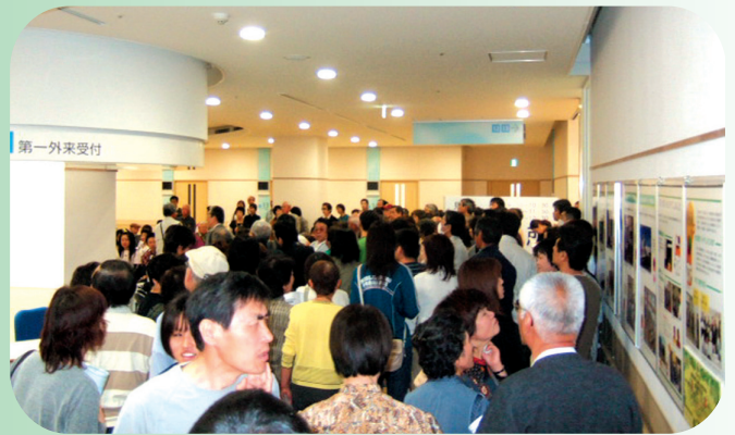
見学開始を待つ方でいっぱい