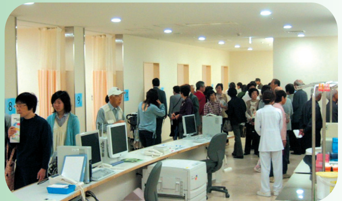
新たに設置された通院治療センター