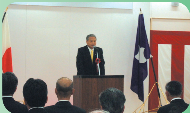
関根囀男前群馬県議会副議長