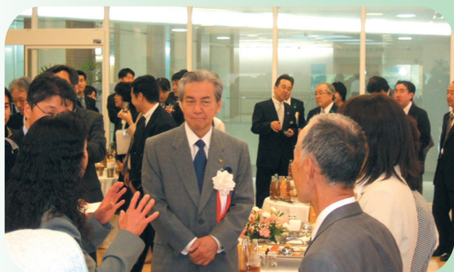
病院ボランティアの皆さんと語り合う小寺知事