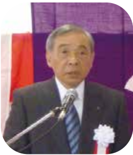
大澤正明群馬県知事