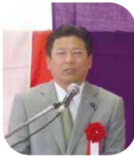
須藤昭男群馬県議会議長