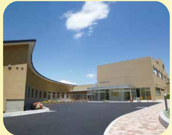
緩和ケア病棟入口