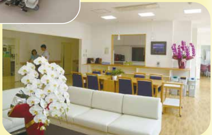
キッチンを併設した談話室