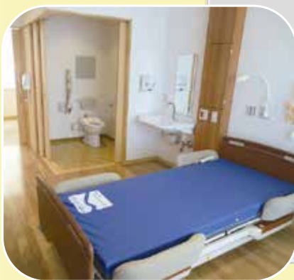
病室 (全室トイレ、洗面台完備)