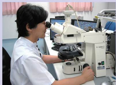
病理検査（細胞検査士による鏡検）