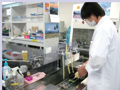
細菌検査（顕微鏡標本を染色しています）