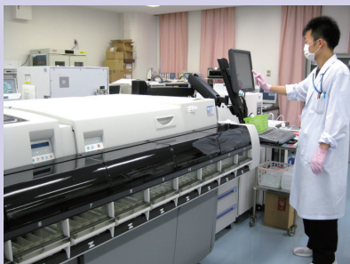
生化学・免疫自動分析装置

病理検査は、組織診検査・細胞診検査を行っています。組織診検査は、手術や内視鏡等で患者さんから採取した組織からがん細胞の有無などを医師に診断してもらうための顕微鏡標本を作製しています。細胞診検査は、細胞検査士が標本を作製し、異型細胞の有無などをスクリーニング（選別）しています。