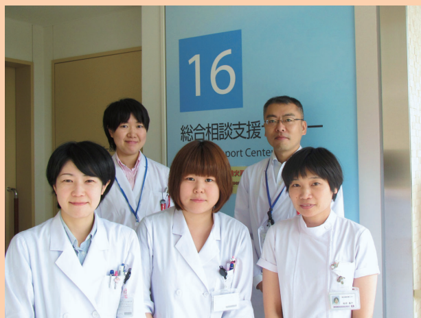
総合相談支援センターの臨床心理士と相談員

面接は当院の通院・入院患者さん、ご家族、ご遺族の方が対象です。1階の総合相談支援センター、担当医、看護師までお申し出ください。